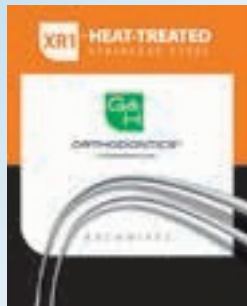
XR1™ Heat Treated Stainless Steel