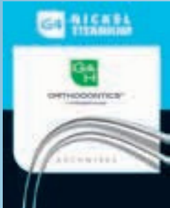
G4™ Nickel Titanium